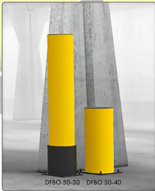
DFBO 50-30 DFBO 50-40